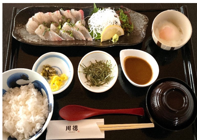
ごまひらす御膳(茶碗蒸し付) 1,750円(税込1,925円)