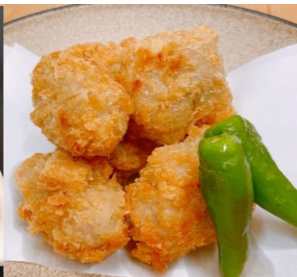
やわらかヒレカツ