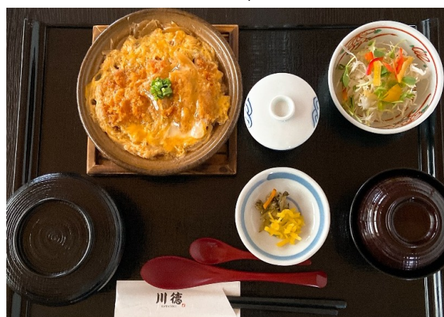
カツとじ定食 1,080円(税込1,188円)