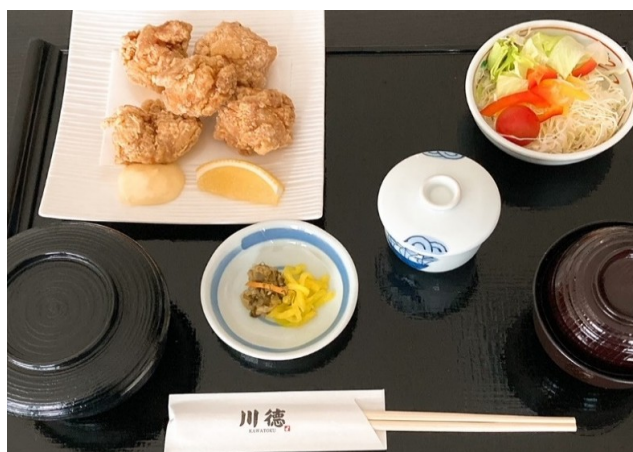
若鶏の唐揚げ定食 1,080円(税込1,188円)