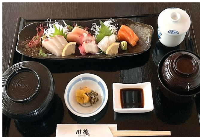
お刺身御膳 1,850円(税込2,035円)