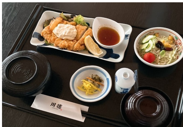
チキン南蛮定食 1,080円(税込1,188円)