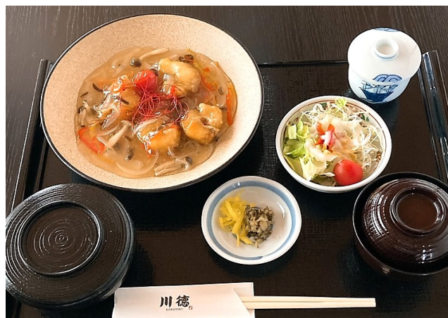
赤魚の野菜あんかけ御膳