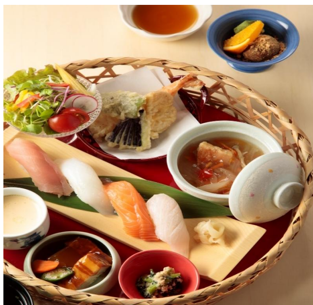
花かご寿司御膳 3,000円(税込3,300円)