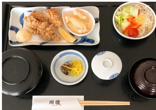
若鶏の唐揚げとエビマヨ定食 1,350円(税込1,485円)