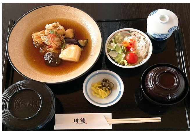
赤魚と豆腐の揚煮御膳