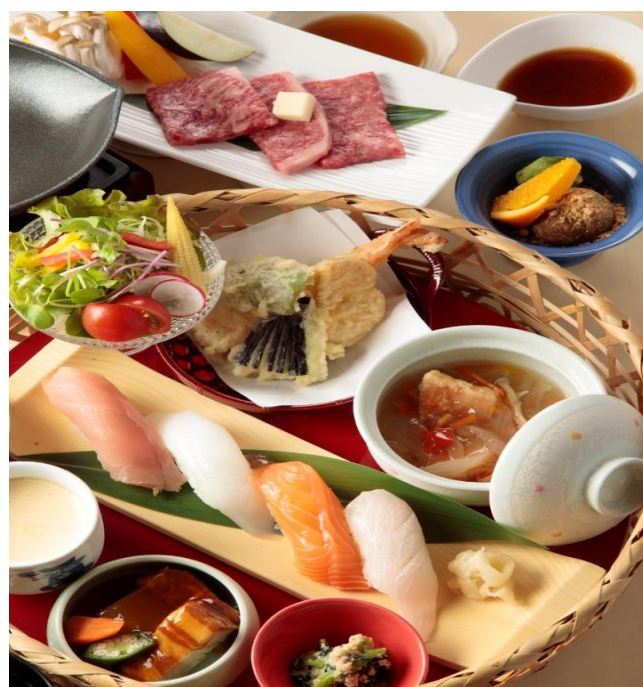
花かご寿司ステーキ御膳 4,300円(税込4,730円)