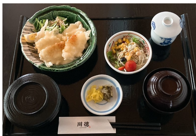
お魚のフリマヨ定食 1,300円(税込1,430円)