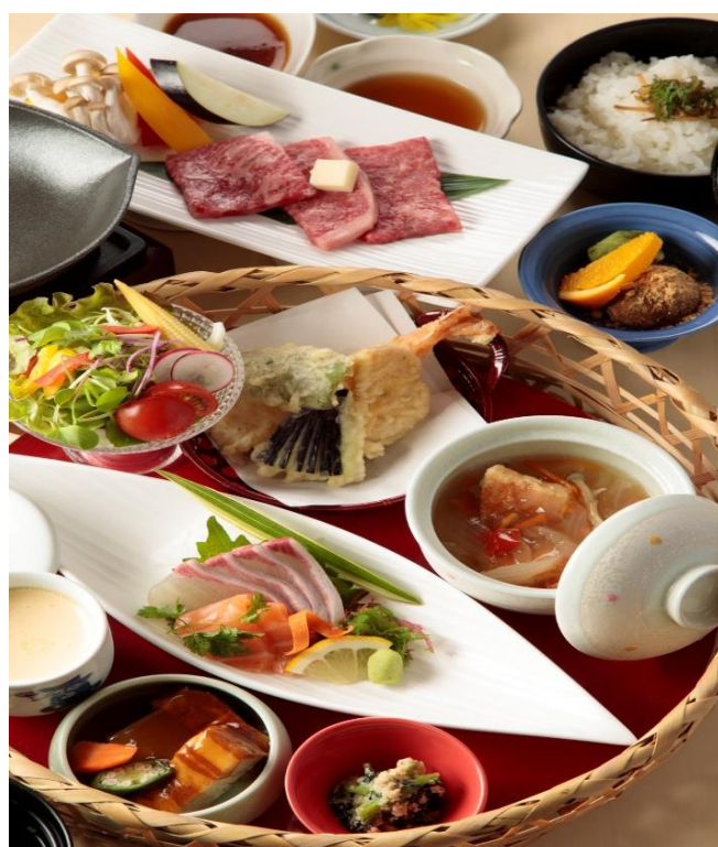
花かごステーキ御膳 3,800円(税込4,180円)