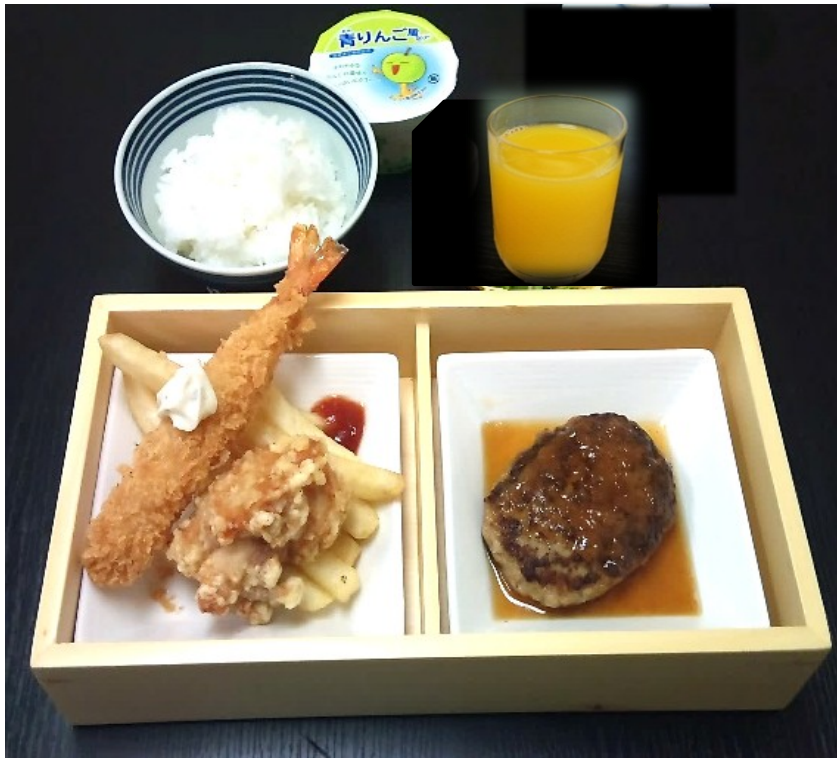
お子様ランチ (ふりかけ・ゼリー付き) 850円(税込935円)