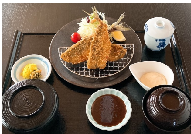
あじフライ定食 1,350円(税込1,485円)