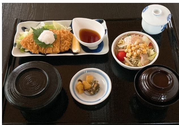
とんかつ定食(おろしポン酢) 980円(税込1,078円)