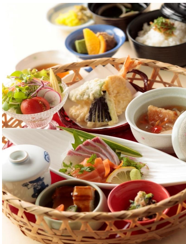
花かご御膳 2,500円(税込2,750円)