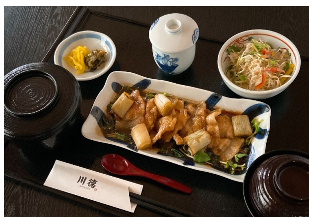
豚ロースと長ネギのオイスター炒め定食 1,080円(税込1,188円)