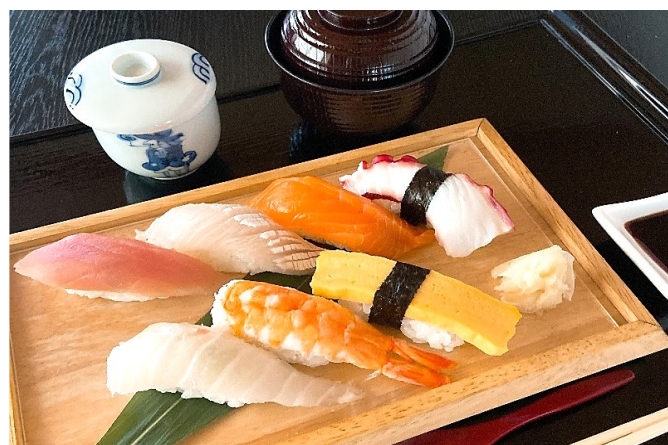
寿司御膳 2,000円(税込2,200円)