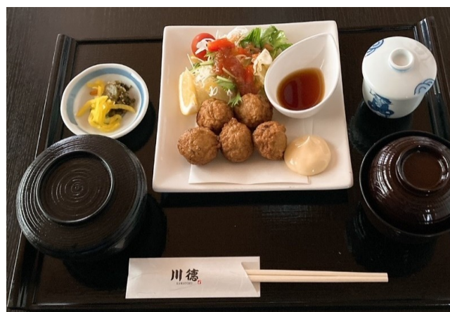
すりみ揚げ定食 1,080円(税込1,188円)