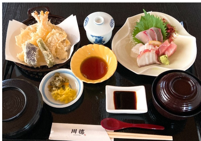
天ぷらお刺身御膳 2,000円(税込2,200円)