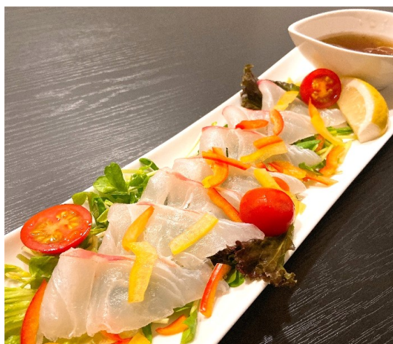
真鯛の和風カルパッチョ