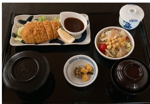
とんかつ定食(ソース) 980円(税込1,078円)