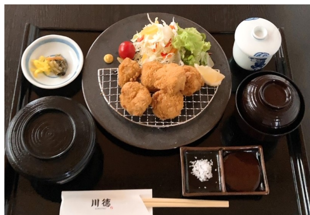
ヒレカツ定食 1,300円(税込1,430円)