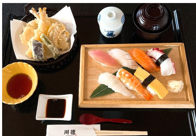
寿司天ぷら御膳 2,500円(税込2,750円)